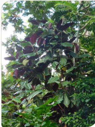
Il peut atteindre jusqu'à 12 m de haut