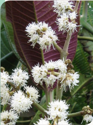
Individu en fleurs