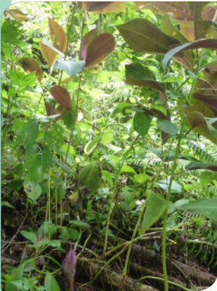
Jeunes plants ayant régénéré à partir de billons laissés au sol