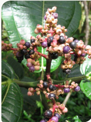
Individu en fruits